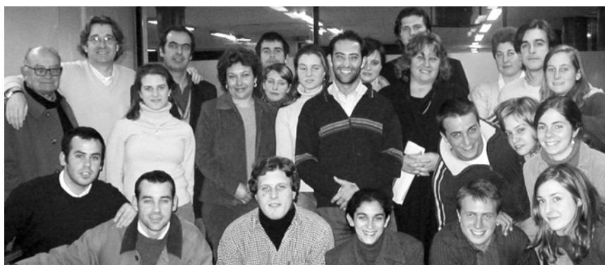
Integrantes de la Asociación